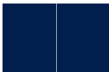
2/1 pagina 420 x 285 mm + 5 mm overfill